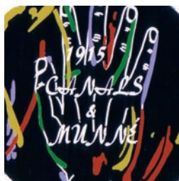
VID Y BODEGA 76