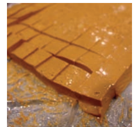
MICHEL WILLAUME 66