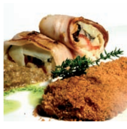
CARLOS GRACIA 16