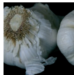
TRUCOS COCINA 80