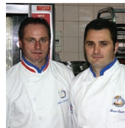
LOS POSTRES DE... 60