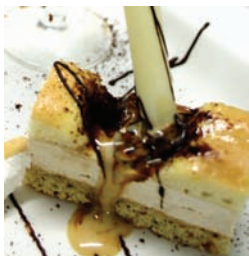
FÉLIX HERNÁNDEZ. 44