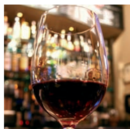
PRESENTAR EL VINO 72