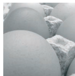
SEGURIDAD ALIMENTARIA 64