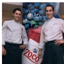
CONCURSO ZOCO 46