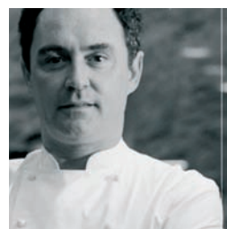
MADRID FUSION 58