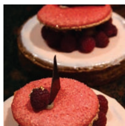
LOS POSTRES DE... 52