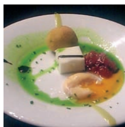
TAPAS Y PINCHOS 40