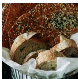
EL PAN 74