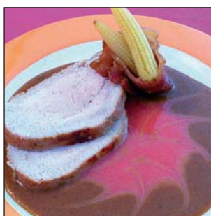
GRETHEL VALDÉS 30