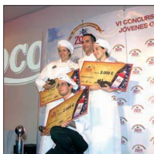
CONCURSO ZOCO 34