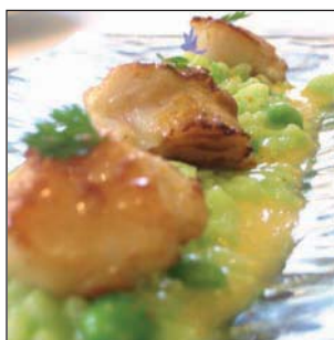
PRODUCTO PLATO 58