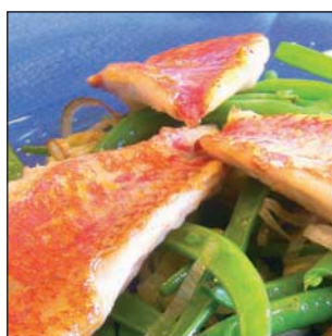
GABRIEL BARTRA 40