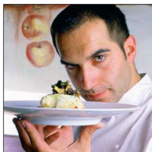
RESTAURANTE COQUE 10