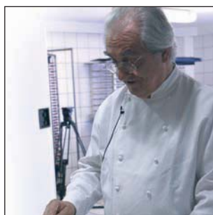
CONCURSO SANT POL 72